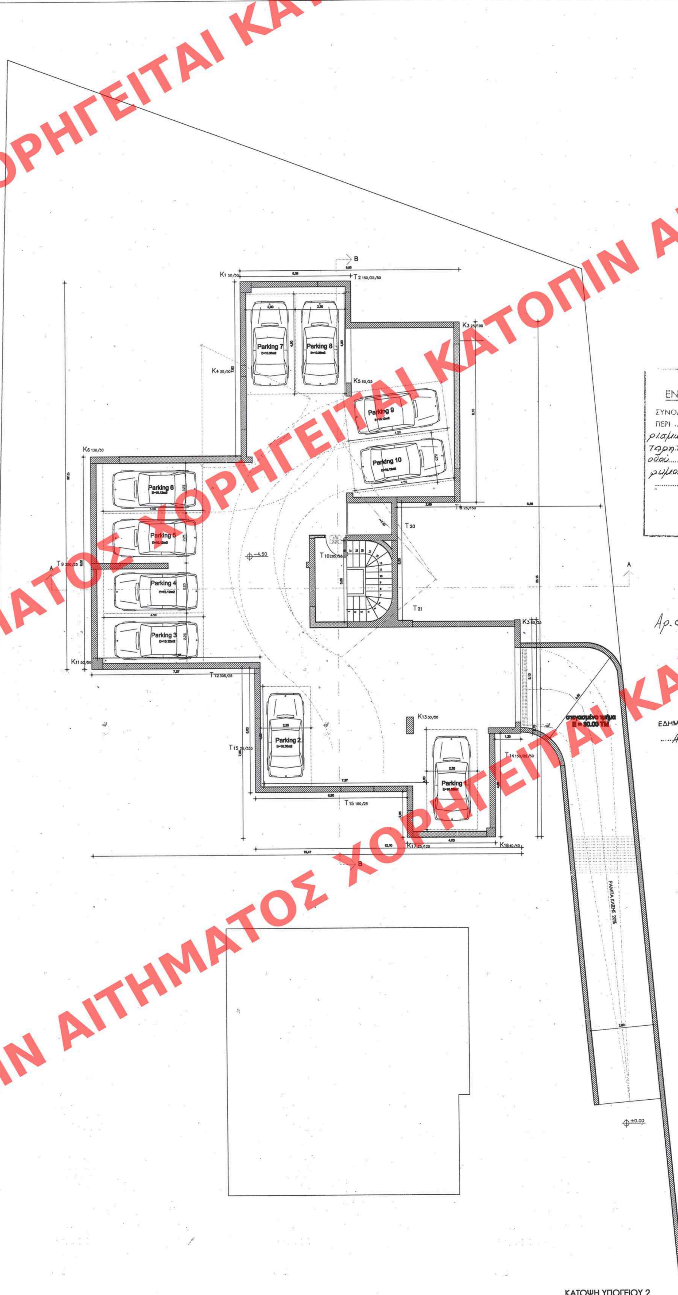
ΚΑΤΩΦΗ ΥΠΟΓΕΟΥ 2

ΥΠΟΥΡΓΕΙΟ ΠΕΡΙΒΑΛΛΟΝΤΟΣ ΕΝΕΡΓΕΙΑΣ & ΚΛΙΜΑΤΙΚΗΣ ΑΛΛΑΓΗΣ ΣΥΝΟΔΕΥΕΙ ΤΗΝ ΥΠ' ΑΡΙΘΜ. Γ.12957/10 ΑΠΟΦΑΣΗ ΠΕΡΙ... καθορισμού... ειδικών... όρων... και περιο- ρισμών... δόμησης... στο οικόπεδο του Δια- τηρητέου... κτιρίου... που βρίσκεται... επί... του... οδού... Κορυτσάς... 11... εντός... του... εγκεκριμένου ρυθμού... εκ... του... Δήμου... Κορυτσάς (υ. Αττικής)